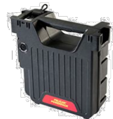
9489 Güç Paketi