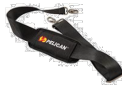
9487 Pedli Omuz Askısı